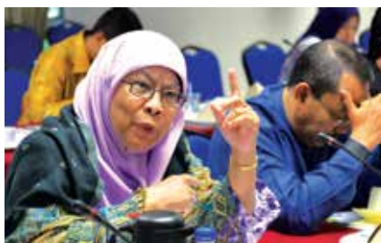
Beberapa orang peserta memberikan idea dan cadangan