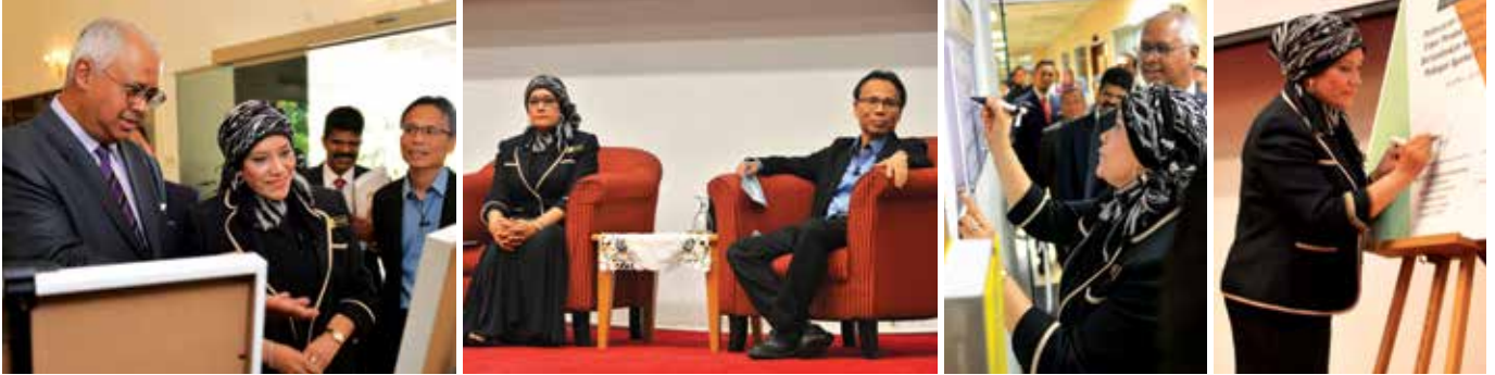
Detik-detik menarik sepanjang majlis