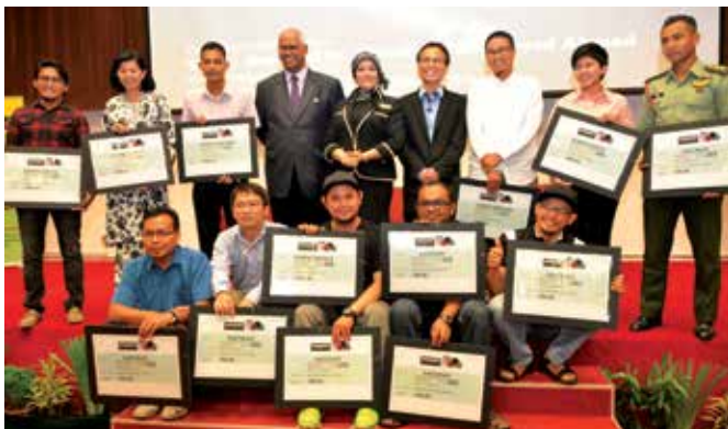
Para pemenang Pertandingan Fotografi In Action bergambar kenangan di akhir majlis