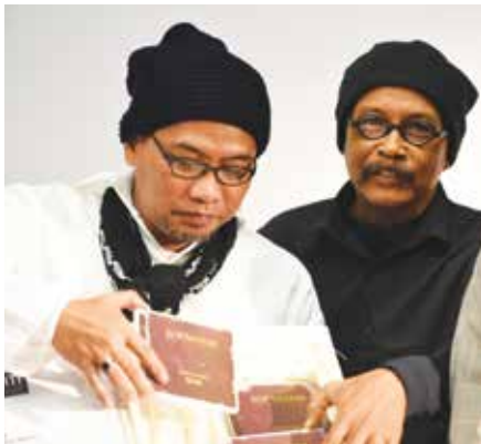
Kumpulan Koprataasa menunjukkan album terkini mereka, Mathnawi Rumi Koprataasa

Melihat daripada perspektif berkenaan, Institut Integriti Malaysia (INTEGRITI) bersama-sama dengan Institut Terjemahan Malaysia (ITBM), Syarikat Luncai Emas Sdn