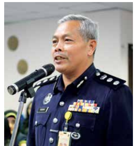
Asisten Komisioner Rabuan Pit antara peserta yang mengajukan soalan ketika sesi soal jawab

INTEGRITI akan menyediakan satu kertas kerja berkaitan isu-isu integriti dalam penjagaan kesihatan kanser untuk diserahkan kepada kerajaan. Tambahnya, ini penting bagi meningkatkan kualiti hidup masyarakat di negara ini.