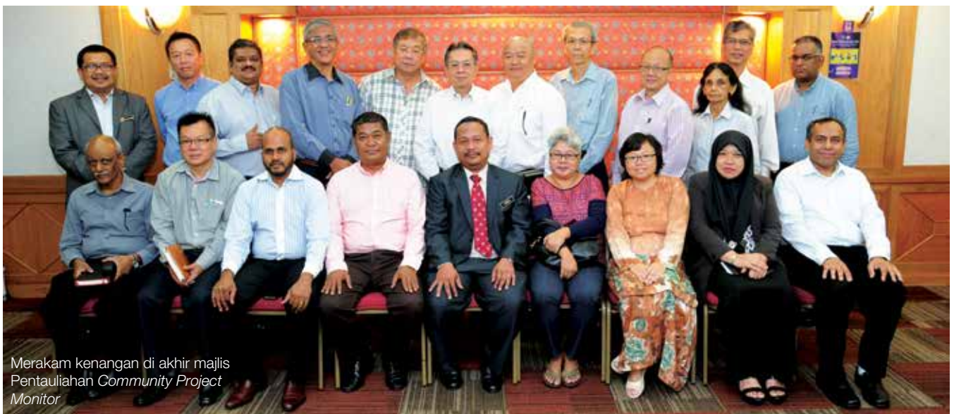
Merakam kenangan di akhir majlis Pentauliahan Community Project Monitor

Berbanding beberapa PBT lain, MPSJ merupakan PBT yang pertama dipilih untuk melaksanakan projek perintis CIB dengan INTEGRITI.