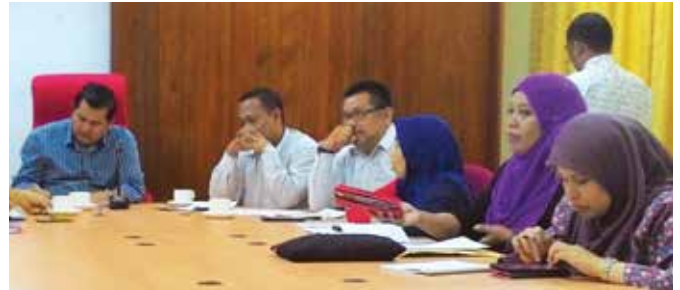
Pertemuan antara INTEGRITI, MBMB dan JPP Zon Paya Rumput

Sementara itu, satu majlis Pentauliahan Community Project Monitor