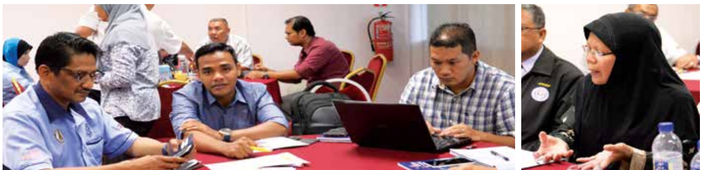
Suasana sekitar bengkel PIPDRM

Menerusi bengkel ini, satu pelan pelaksanaan strategik untuk membimbing warga PDRM bergerak ke hadapan menerusi pelbagai program dapat dirangka. Ini perlu agar setiap warga PDRM sentiasa 'sehaluan' dan bersatu padu sebagai satu pasukan yang mantap sama ada pada peringkat pengurusan mahupun operasi.