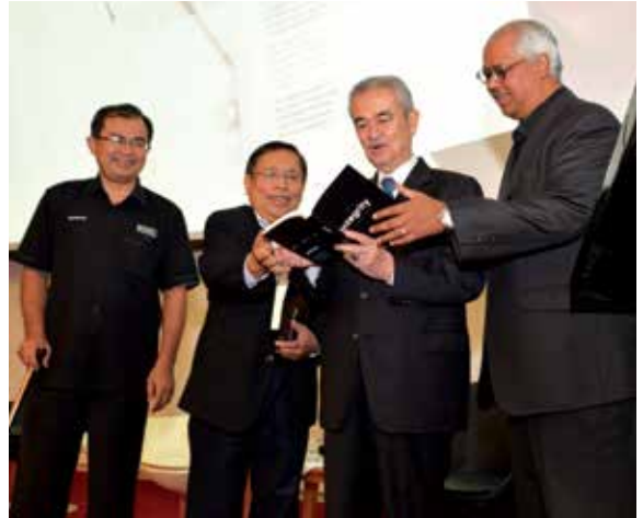
YABhg. Tun Abdullah Hj. Ahmad Badawi membelek buku 'A National Integrity System' terbitan INTEGRITI