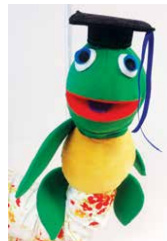
SAM, boneka maskot INTEGRITI

Perbincangan awal dalam bengkel ini amat perlu dalam membantu INTEGRITI memperkukuhkan, memperlengkapkan serta memantapkan MIPS agar ia berjaya dihasilkan sebagai suatu modul terkini dan tersendiri tanpa wujud unsur peniruan atau pengulangan terhadap modul prasekolah yang sedia ada. Ini sekali gus membolehkan MIPS dilaksanakan di beberapa tadika terpilih pada masa akan datang sebagai projek perintis.