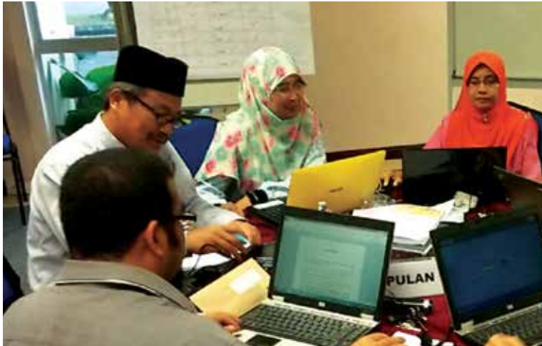
Suasana sekitar bengkel

Melentur buluh biarlah daripada rebungunya, pepatah yang tidak asing lagi dalam kehidupan masyarakat kita. Menyedari keperluan penerapan nilai-nilai murni pada peringkat awal kanak-kanak, Institut Integriti Malaysia (INTEGRITI) baru-baru ini telah mengambil inisiatif menghasilkan modul baharu bagi kanak-kanak prasekolah yang dinamakan Modul INTEGRITI Prasekolah (MIPS).