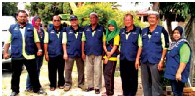
Jawatankuasa Pemantau CIB di Melaka

Lawatan selama sehari ini nyata memberikan banyak manfaat kepada para peserta GILC terutamanya apabila mereka berpeluang melihat sendiri dan bertanya terus kepada pasukan pemantau CIB di kedua-dua pihak berkuasa tempatan (PBT). Bahkan, pengalaman ini bakal menyemarakkan lagi semangat integriti di kalangan mereka.