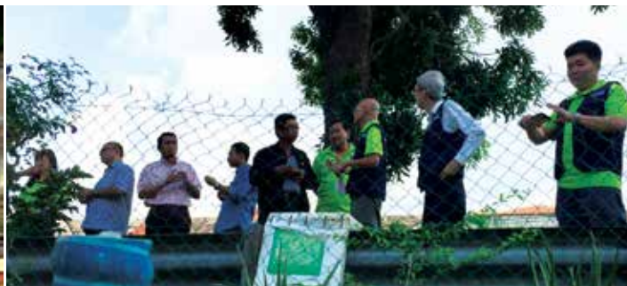
Suasana sekitar lawatan di tapak CIB di Subang Jaya