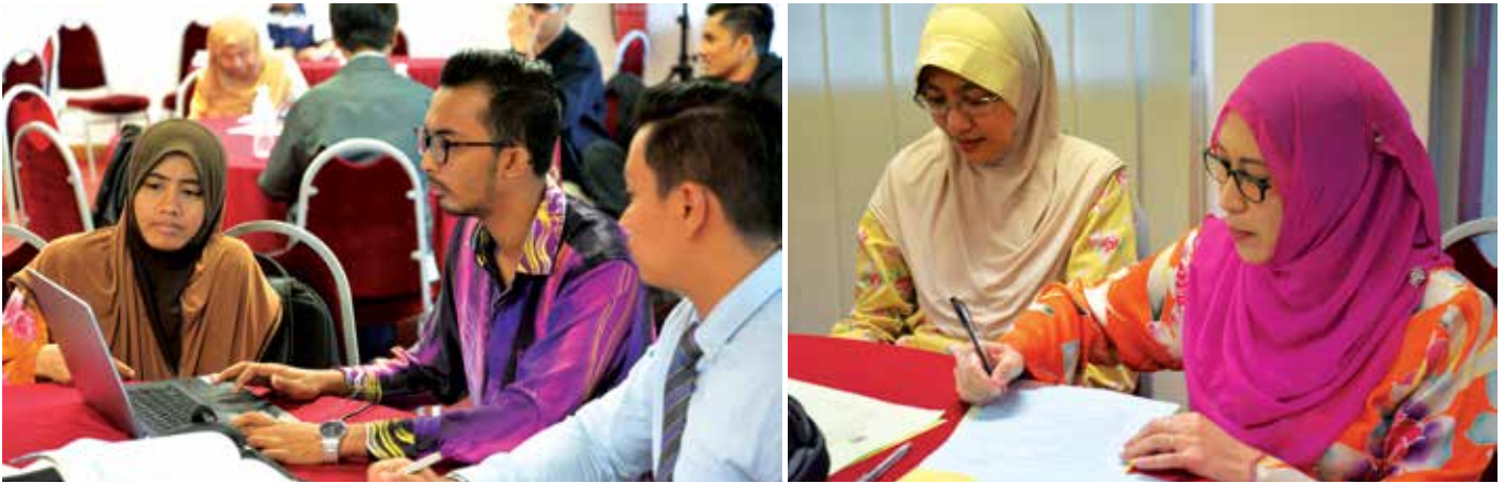
Suasana sekitar bengkel