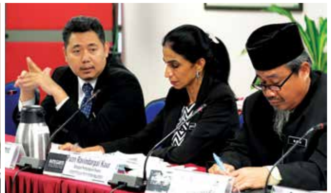
Suasana sekitar perbincangan meja bulat