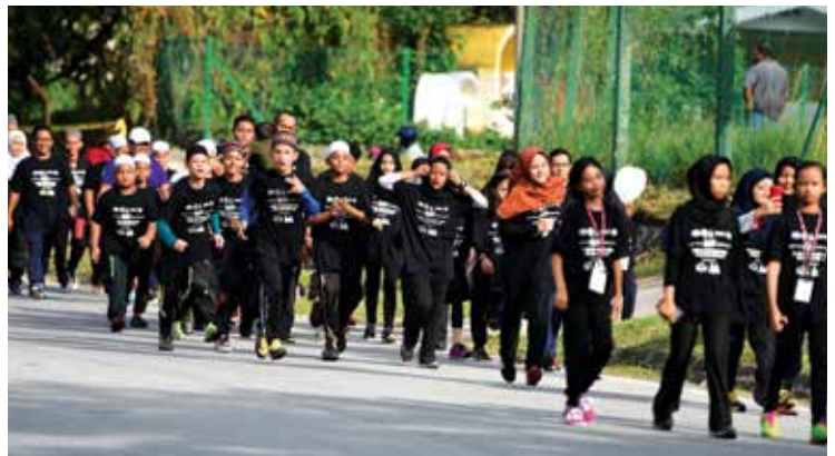
Suasana sekitar program

Sepanjang 'Family INTEGRITI Walk' berlangsung, orang ramai yang hadir berpeluang mengunjungi pameran kesihatan daripada pelbagai agensi di samping mendengar taklimat kesihatan daripada pegawai yang bertugas. Sementara itu, para penjaja di Pasar Muhibah pula menerima buah tangan berbentuk pelek INTEGRITI untuk ditampal di premis masing-masing.