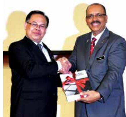
Pelancaran Modul Latihan Agensi Penguatkuasaan