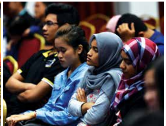
Sebahagian daripada penonton teater