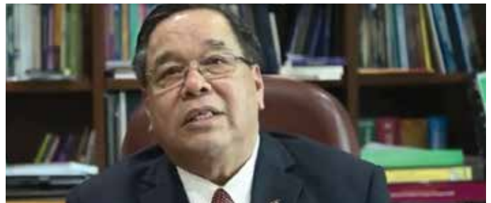
Tan Sri Dato' Seri Dr. Abdullah bin Md Zin

Penerbitan video kapsul berdurasi tiga (3) minit ini merupakan outreach program Institusi Agama INTEGRITI untuk mendekati dengan penonton TV AlHijrah. Menepati objektif utama penerbitan kapsul ini adalah untuk meningkatkan kesedaran kepentingan pengamalan nilai-nilai integriti dalam kalangan masyarakat. Mesej-mesej yang disampaikan juga bertujuan untuk memantapkan akhlak dan nilai perilaku sebagai seorang individu yang berintegriti. Selain itu, video ini juga bertujuan untuk memperkukuhkan persefahaman dan perpaduan masyarakat pelbagai agama di Malaysia.