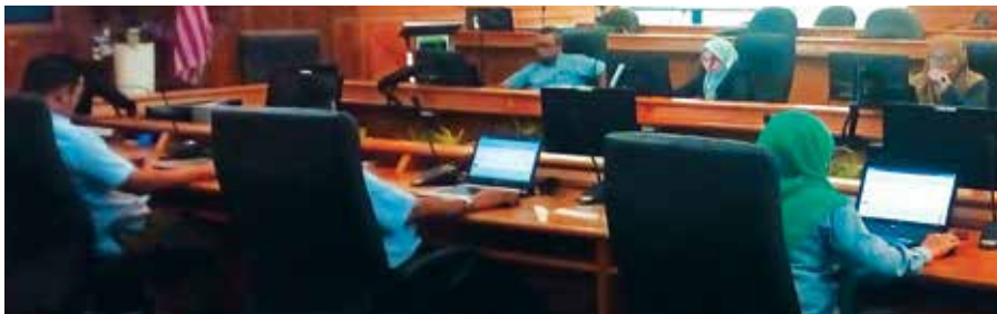
Sebahagian kakitangan MPSJ menduduki ujian MIP

Dengan kepercayaan dan sokongan yang diberikan oleh organisasi pelbagai sektor, INTEGRITI berharap laporan keputusan MIP yang akan dikeluarkan mampu memberikan garis panduan perancangan pembudayaan integriti dalam organisasi, agar diselaraskan dengan tahap integriti individu dalam organisasi tersebut.