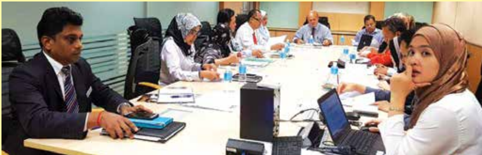
Mesyuarat penyelarasan dihadiri wakil INTEGRITI dan PETRONAS bagi membincangkan penganjuran National Integrity Convention 2017 .