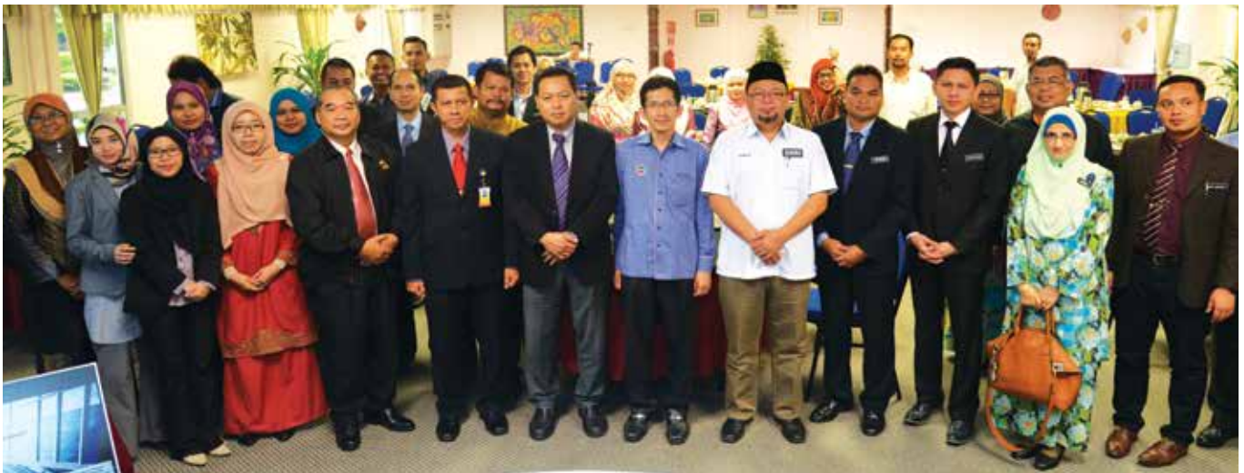
Para peserta yang menyertai Breakfast Talk INTEGRITI: Belia Melestarikan Keamanan pada 22 Ogos 2017.

Rata-rata peserta Program Breakfast Talk INTEGRITI Siri 9/2017 yang mengupas topik “Belia Melestarikan Keamanan: Perspektif Integriti” berpandangan bahawa golongan belia perlu diberi bimbingan bersifar holistik bagi menjadikan mereka rakyat yang berkualiti.