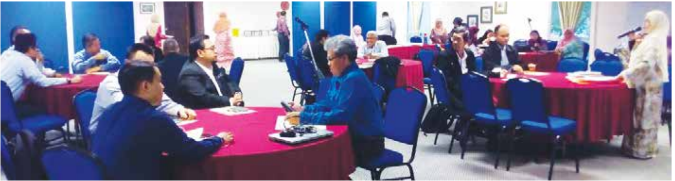
Bengkel Semakan Semula Pelan Integriti Organisasi disertai oleh pegawai-pegawai Jabatan Kerja Raya.

Institut Integriti Malaysia (INTEGRITI) terus mendapat jemputan untuk menjadi pusat rujuan agensi-agensi awam memperkukuhkan amalan integriti di organisasi masing-masing. Terbaharu pada bulan Ogos, Jabatan Kerja Raya (JKR) dengan kerjasama INTEGRITI telah melaksanakan Bengkel Semakan Semula Pelan Integriti Organisasi (PIO). Ia telah berlangsung pada 9 dan 10 Ogos.