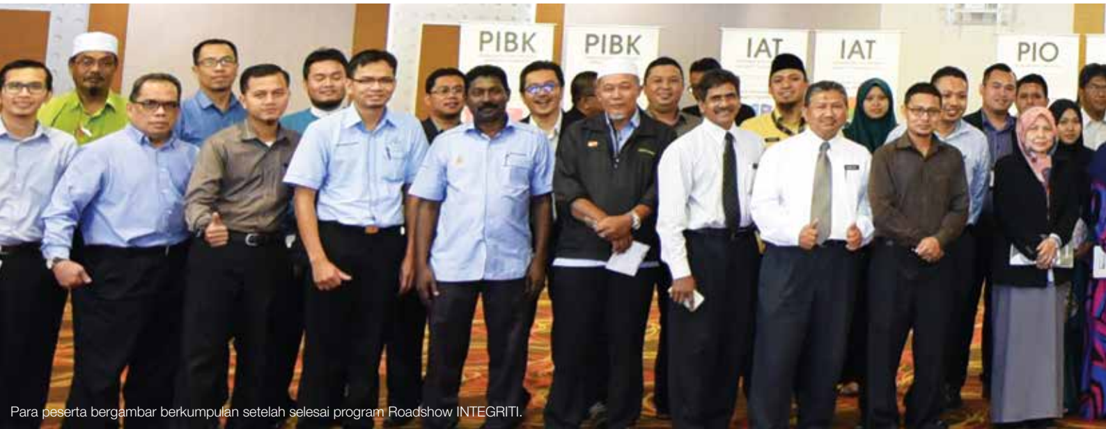
Para peserta bergambar berkumpul setelah selesai program Roadshow INTEGRITI.

“Dalam menangani isu integriti, salah laku, penyelewengan dan jenayah rasuah dalam kalangan penjawat awam di Selangor, Pejabat SUK sentiasa memantau dan mengambil perhatian terhadap informasi dan maklumat yang disalurkan oleh kakitangan atau orang awam sendiri.”