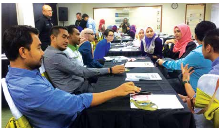
Participants taking part actively during the discussion session.

The operations of PHB involves in the purchase of commercial properties and the sales of shares or equities to Bumiputra customers. This is to provide the latter with opportunities to invest in commercial properties. Since huge amounts of money are involved in the purchasing and selling of these properties, ensuring compliance in its procedures and business ethics is