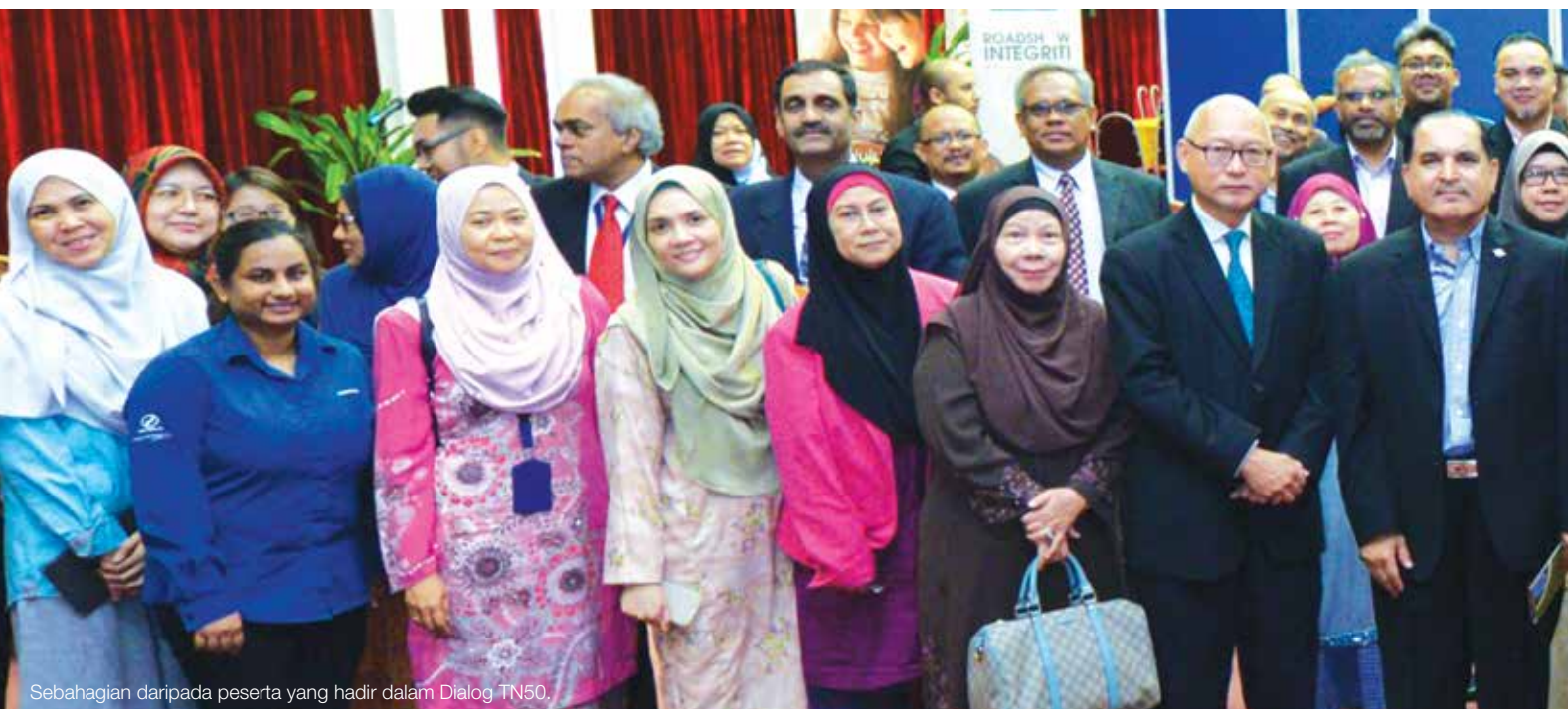
Sebahagian daripada peserta yang hadir dalam Dialog TN50.

Menurut beliau, konsep cultural change merupakan satu proses transformasi jangka panjang. Ia memerlukan penglibatan setiap lapisan masyarakat terutamanya institusi keluarga dalam mendidik anak seawal usia, bak kata pepatah “melentur buluh biarlah dari rebungnya”. Segmen kedua melibatkan dialog bersama Senator Datuk Paul Low Seng Kuan, Menteri di Jabatan Perdana Menteri. Beliau turut mengumumkan bahawa Kabinet baru-baru ini telah memutuskan untuk menubuhkan Jabatan Integriti dan Tadbir Urus Negara, yang merupakan satu langkah menaik taraf Bahagian Integriti dan Tadbir Urus (BITU).