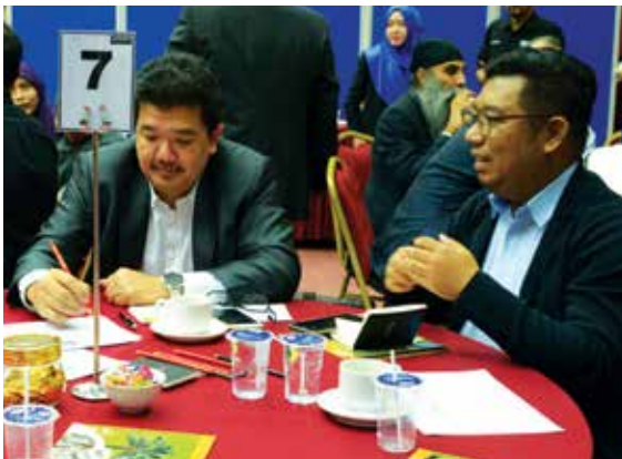
Sesi perbincangan Dialog TN50.