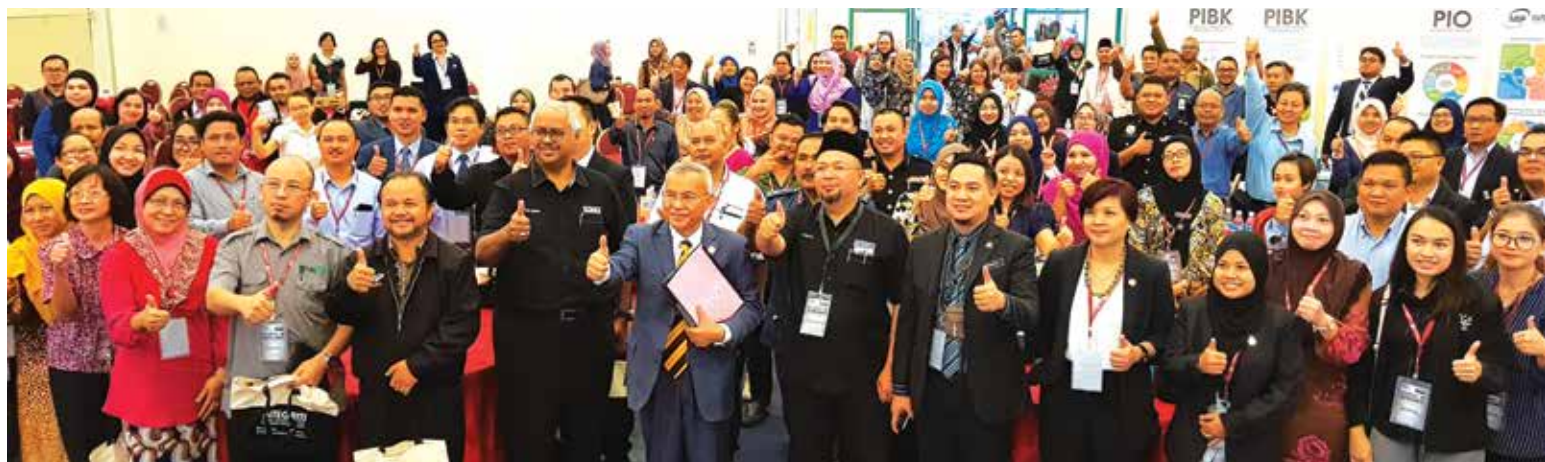
Gambar berkumpulan di akhir Roadshow INTEGRITI peringkat Negeri Sarawak bersama Datuk Talib Zulpilip (tengah).

Datuk Amar Abang Haji Abdul Rahman Johari berkata, inisiatif seperti Roadshow INTEGRITI seharusnya dilaksanakan dengan kerap agar pembudayaan integriti secara konsisten dapat diterapkan dalam diri setiap individu.