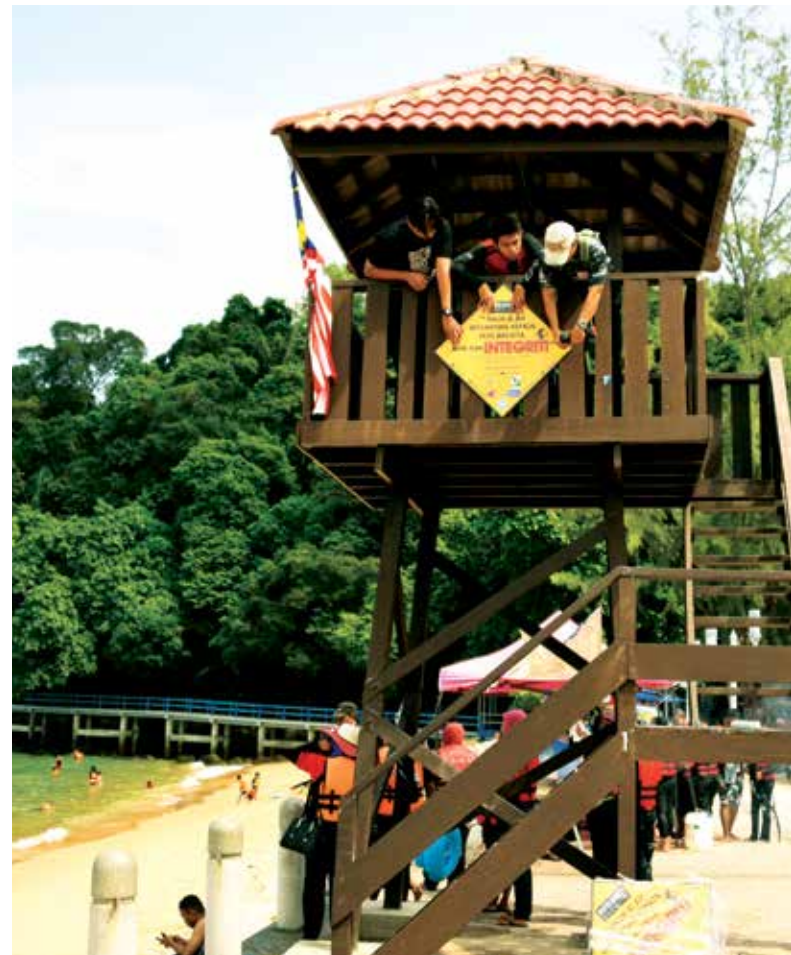
Pemasangan signage LelKA di Pulau Tioman.

Namun begitu, beliau tidak menafikan yang soal ketidakmampuan suami, isteri mahupun anak-anak menguruskan