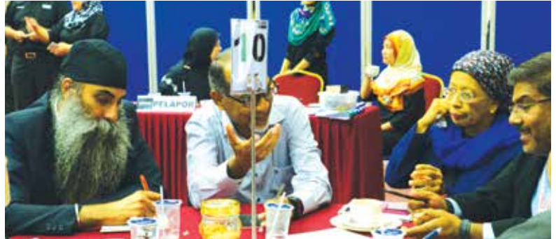
Peserta Dialog TN50 dengan aktif menyertai sesi perbincangan.

Hampir 100 peserta yang terdiri daripada pelbagai kaum, usia dan latar belakang termasuk wakil-wakil pertubuhan masyarakat sivil, seorang senator dari Pakatan Harapan dan seorang penuntut praktikal (intern) dari Pejabat Datuk Paul Low turut menyertai Sesi Dialog TN50.