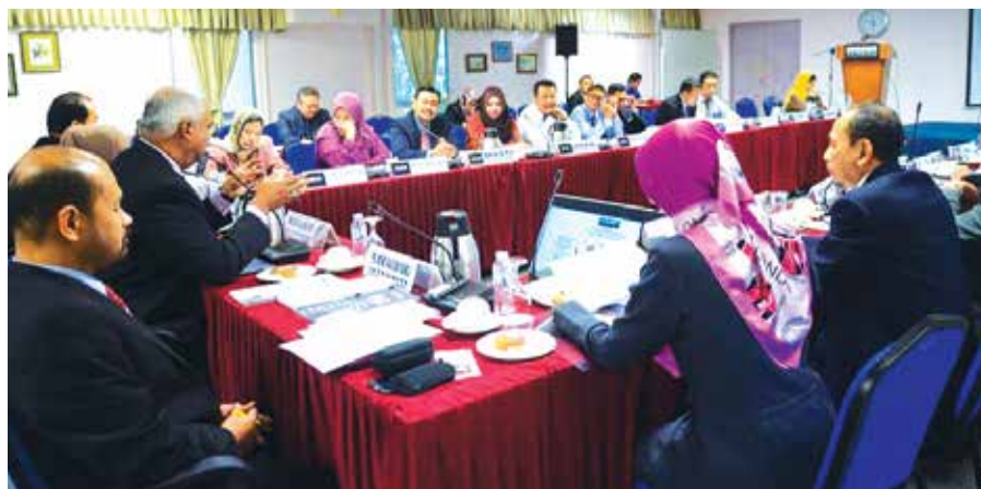
Sesi RTD membincangkan status pelaksanaan integriti institusi keluarga.