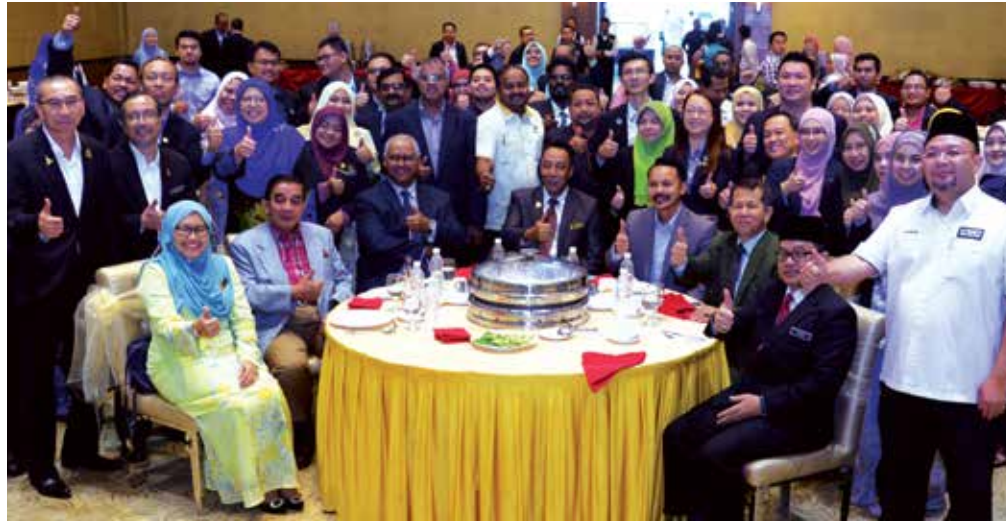
Program INTEGRITI's Breakfast Talk yang berlangsung di Klang.

INTEGRITI's Breakfast Talk buat julung kali diperkenalkan pada tahun 2015.