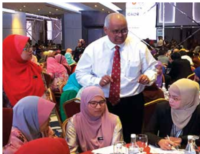
Datuk Dr. Anis Yusal Yusoff sedang berbincang dengan peserta di Roadshow INTEGRITI.

“INTEGRITI akan memberikan khidmat nasihat dan cadangan kepada pihak-pihak berkepentingan melalui contoh-contoh program yang telah dilaksanakan termasuk pengenalan kepada beberapa instrumen yang telah dibina bagi tujuan