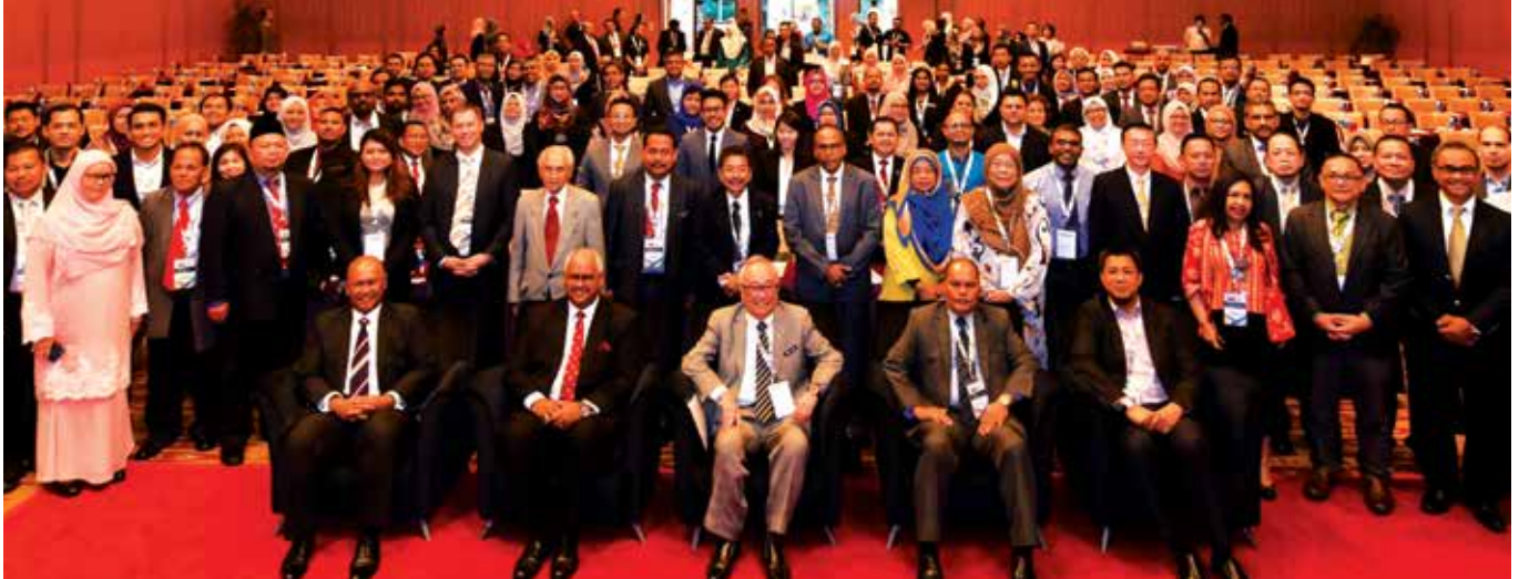
Participants of NIC 2017 in a group photo with Datuk Paul Low Seng Kuan.

Corruption, according to him, would persist as long as there are parties who are prepared to pay their way into lucrative contracts and favours.