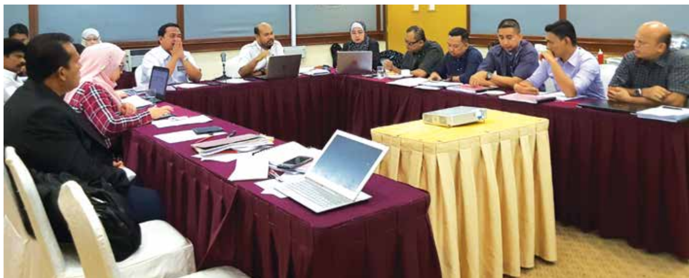
Peserta bengkel sedang memperhalusi penambahbaikan Pelan Integriti Nasional.