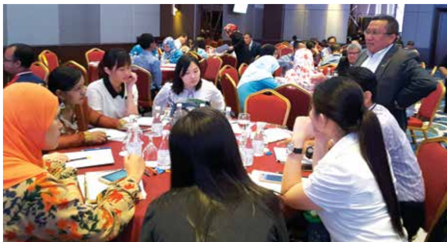
Sekitar sesi Bengkel Halatuju sewaktu Roadshow INTEGRITI.

Selain berkongsi maklumat interaktif ketika singgah di setiap negeri, kata beliau, melalui Roadshow INTEGRITI pihak sekretariat mengumpulkan isu-isu yang dibangkitkan daripada peserta setiap sesi pertemuan.