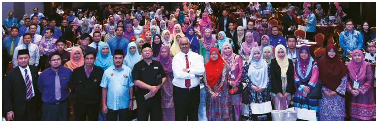
Peserta bergambar berkumpul di akhir Program Roadshow INTEGRITI di Johor Bahru.

Program Roadshow INTEGRITI peringkat Negeri Johor diadakan dengan kerjasama Unit Integriti Pejabat Setiausaha Kerajaan Negeri Johor, yang turut mengadakan Konvensyen Integriti Negeri Johor. Ini merupakan kali pertama program Roadshow INTEGRITI diadakan sempena sambutan Bulan Integriti dan bersama penganjuran Konvensyen Integriti Negeri Johor. Majlis penutup Konvensyen Integriti Negeri Johor dan Roadshow INTEGRITI Negeri Johor disempurnakan oleh Setiausaha Kerajaan Johor, Dato’ Azmi Rohani.