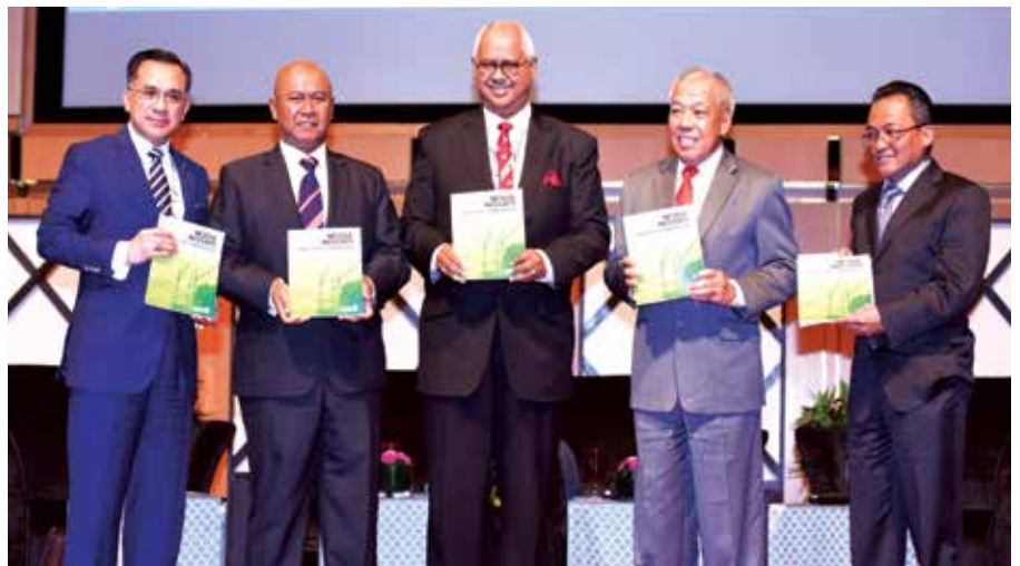
Pelancaran Modul Integriti Industri Pembinaan sempena National Integrity Convention 2017.

Modul ini terdiri daripada tiga komponen utama iaitu PIN: Prinsip dan Falsafah, Amalan Kod Etika Kontraktor Industri Pembinaan dan Rasuah Dalam Industri Pembinaan.