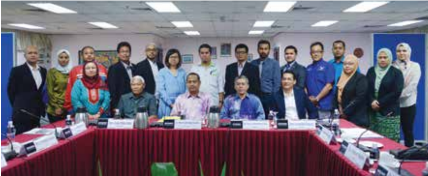
Wakil pelbagai pertubuhan masyarakat sivil dan badan bukan kerajaan yang mengambil bahagian dalam Perbincangan Kumpulan Fokus di Menara INTEGRITI.

Bagi mendapatkan pandangan pertubuhan masyarakat sivil dan bukan kerajaan mengenai kerjasama dua hala serta input mengenai program-program berimpak tinggi, Institut Integriti Malaysia (INTEGRITI) menganjurkan Perbincangan Kumpulan Fokus (FGD). Perbincangan yang berlangsung pada 14 Disember bertujuan mendapatkan input mengenai kerjasama dua hala dan program-program pengukuhan integriti