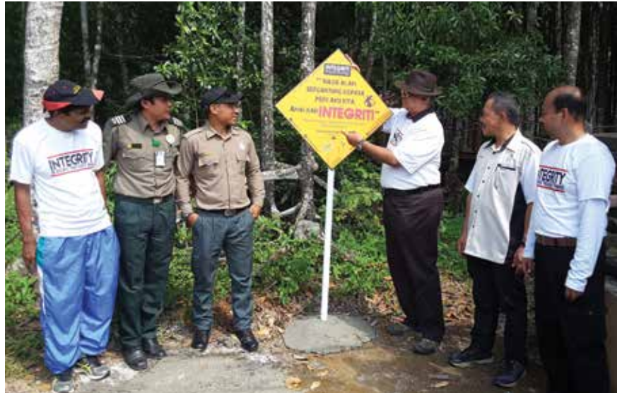
INTEGRITI meletakkan signage LelKA di Hutan Paya Laut Matang, Kuala Sepetang, Perak dengan disaksikan oleh kakitangan hutan simpan bakau itu.

“Hutan Paya Laut Matang merupakan satu lagi destinasi untuk kembali ke alam,” demikian rumus Hairudin. “Ia diiktiraf sebagai hutan paya laut yang diurus