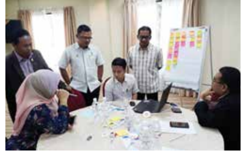
Sesi percambahan minda membabitkan kakitangan KEJORA.