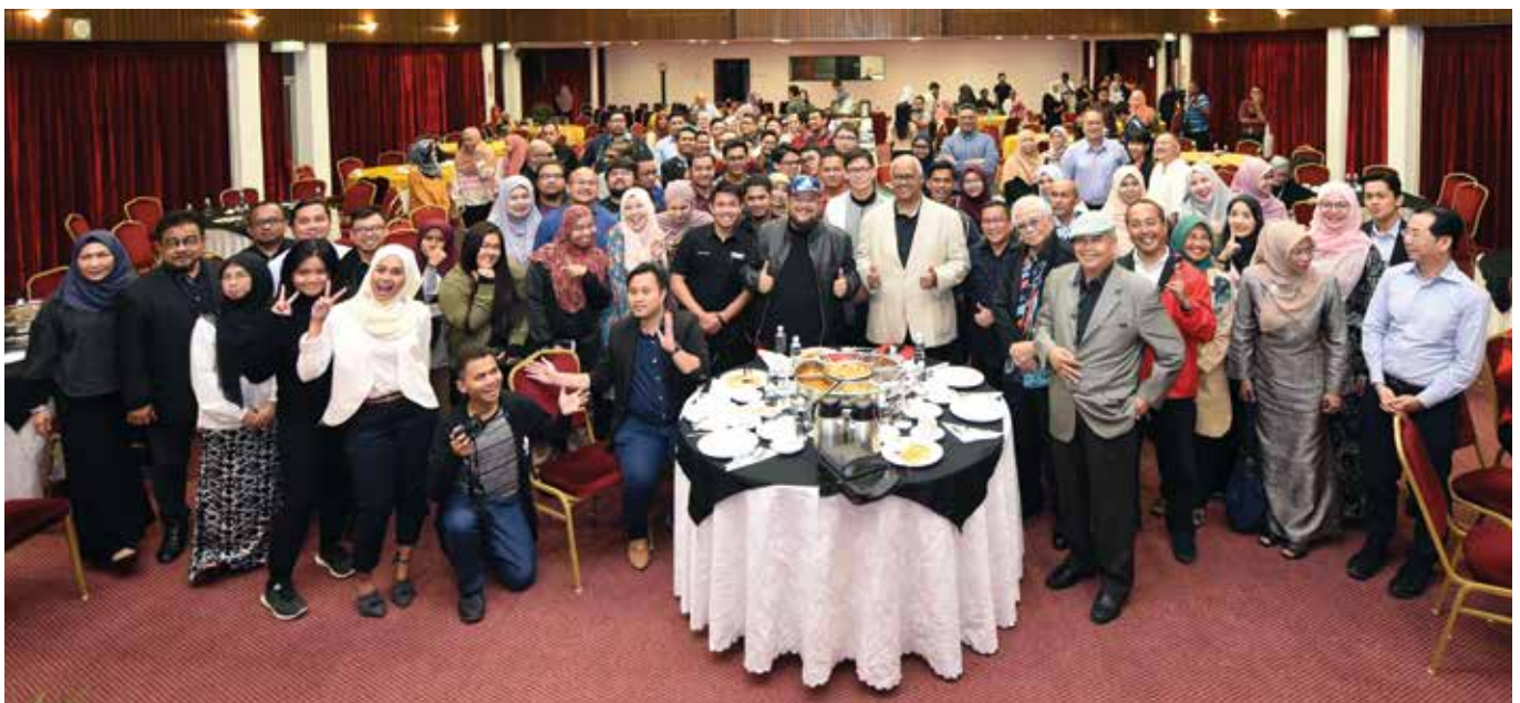
Para hadirin yang menjayakan Komedi Berdiri Integriti di Menara INTEGRITI pada 7 Februari lalu. Antara yang hadir mantan Panglima Angkatan Tentera Jeneral (B) Tan Sri Ghazali Md Seth dan pelakon filem dan drama Dato' Ahmad Tarmimi Serigar.

Justeru, berdasarkan kepada perkembangan industri komedi yang semakin pesat di Malaysia, INTEGRITI melihat ia sebagai langkah yang amat baik jika komedi dan integriti dapat digabung jalin agar dapat menjadi medium yang paling berkesan untuk mendidik masyarakat dalam membudayakan integriti terutamanya golongan kanak-kanak dan remaja.