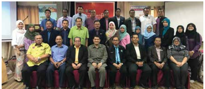
Kakitangan KEJORA bergambar bersama pegawai-pegawai dari INTEGRITI di akhir bengkel PIO.

INTEGRITI akan terus menghulurkan khidmat nasihat kepada KEJORA.