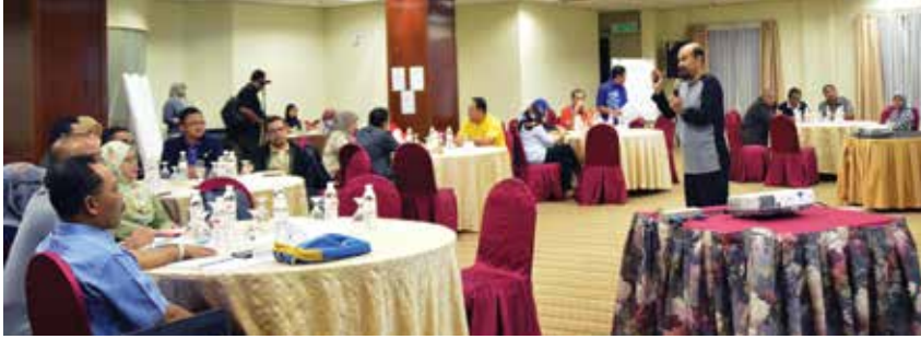
Penyelaras Profil Integriti Malaysia, Mohd Rais Ramli mengendalikan bengkel PIO.