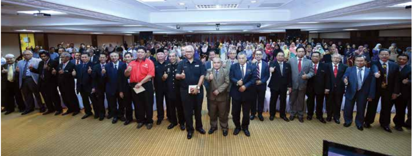
Sesi foto berkumpul di akhir Roadshow INTEGRITI peringkat negeri Kelantan yang berlangsung di Bangunan SUK, Kota Bharu.